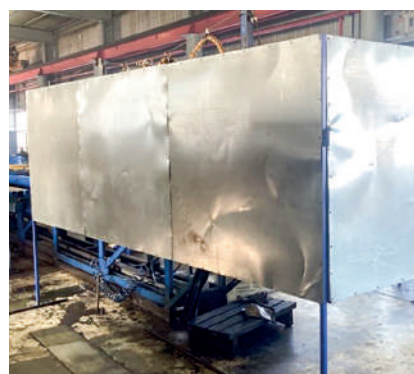
Участок по изготовлению НКТ (стало)

Для решения данной проблемы собственными силами был изготовлен и установлен защитный кожух, который позволил: закрыть движущиеся части оборудования; оградить узлы установки, находящиеся под высоким давлением; предотвратить нахождение рабочего персонала в опасной зоне при работе установки гидроиспытания НКТ; защитить персонал в случае нештатной ситуации с установкой – порыв РВД, механические поломки и т.д.