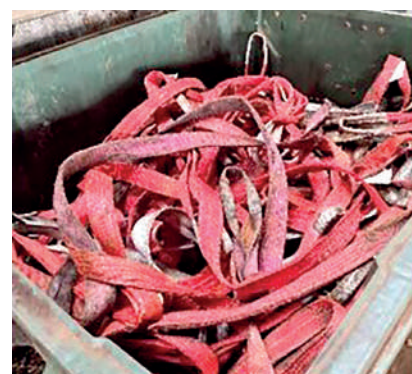
Текстильные кольца в контейнерах

С целью более активного вовлечения персонала цеха в процессы «Охрана труда», «Качество», «Производительность» с 01.04.2023г. в СЦ № 2 было решено начать проведение рейтингования бригад по данным направлениям. Для этого был разработан алгоритм оценки бригад, где ежедневно отмечается достигнутый результат их работы за отработанную смену, заполняется стенд, где визуализированы показатели работы каждой бригады, лучшая из которых будет поощряться.