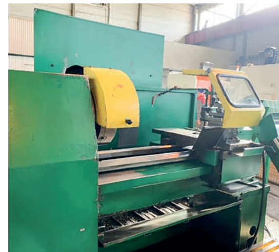
Токарный станок (стало)

Также механическим цехом решен еще один немаловажный момент – для безопасного пребывания на производственных площадках посетителей (проверяющих инспекторов, ИТР, работников спецорганизаций, водителей и др.) при входе в цех была организована зона, где установили крючки с дежурными касками.