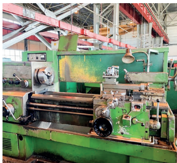
Токарный станок (было)

Для защиты оператора в области патрона разместили дугообразный защитный экран, с целью удобства он был изготовлен в виде откидной конструкции, которую можно легко поднять при смене детали или инструмента. Кроме того, подвижное и поворотное защитное ограждение установили на продольном суппорте токарного станка.