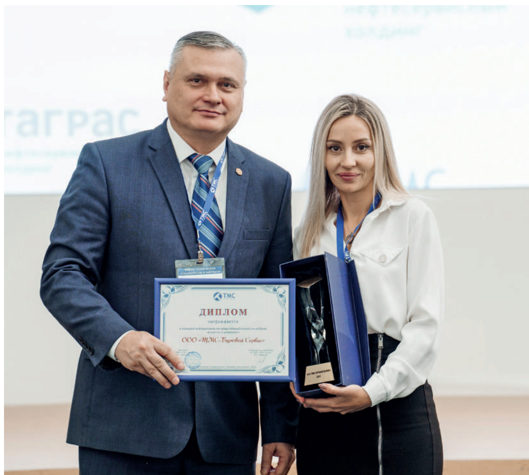
Награждение на Форуме технических специалистов и мастеров за лучший видеоролик

Кроме того, девушка – активный новатор, участник проектной деятельности, назначена ответственным за