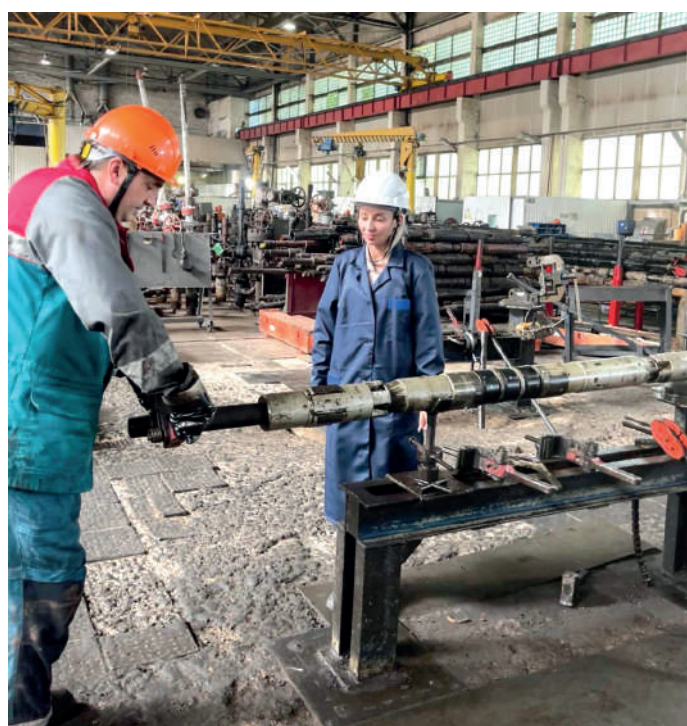
На производственной площадке